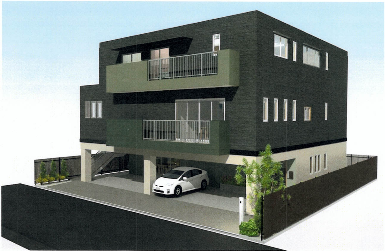
ひのきのその 完成予定図